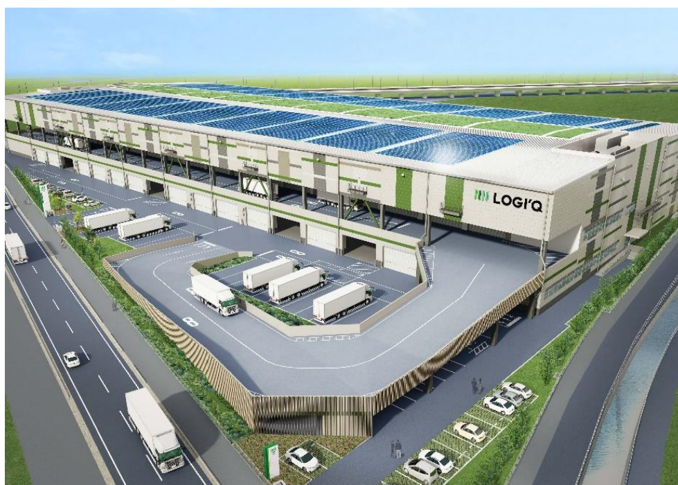
ロジス EC 関東が入居する「LOGI'Q 白岡Ⅱ」